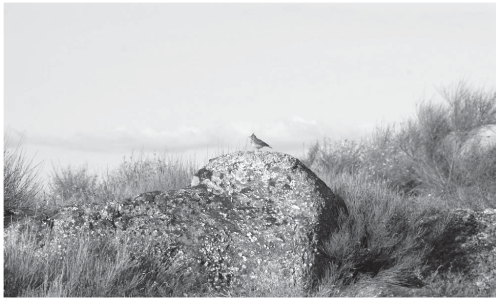
O Barrocal pedras com identidade

O encontro, organizado pela Cultura Vibra, com o apoio da Sociedade dos Amigos do Museu de Francisco Tavares Proença Júnior e da Lupa – Laboratório