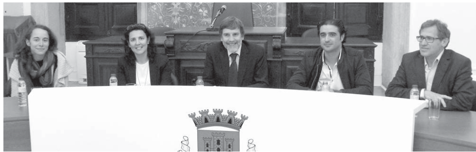
A mesa, na apresentação do Dia da Criança, feita no Salão Nobre da Câmara

Com o lema Upa Lupa no Dia da Criança as atividades