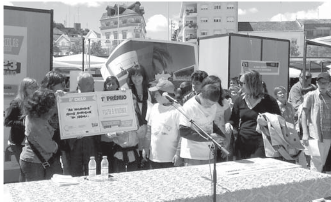
A entrega dos prémios aos projetos vencedores dos 2º e 3º ciclos do Ensino Básico

Com esta iniciativa várias escolas dos concelhos da Comunidade Intermunicipal da