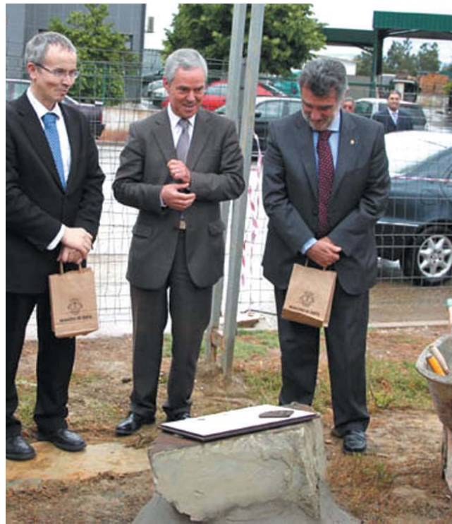
Cerimónia de lançamento da primeira pedra