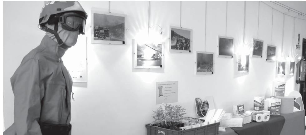
Exposição na Academia de Judo Ginásio de Castelo Branco

Em paralelo está também uma exposição relativa à floresta e à sua indústria, desde as pe-