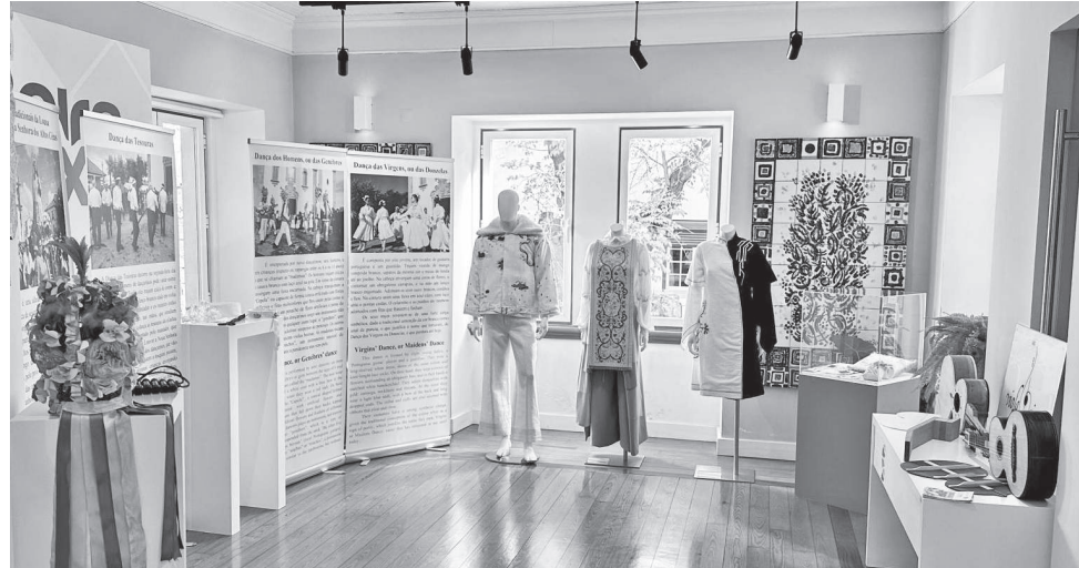
A exposição pode ser visitada no Posto de Turismo

Assim, até domingo, é possível visitar no Posto de Turismo de Castelo Branco, uma exposição, que contempla o Bordado de Castelo Branco, as Danças