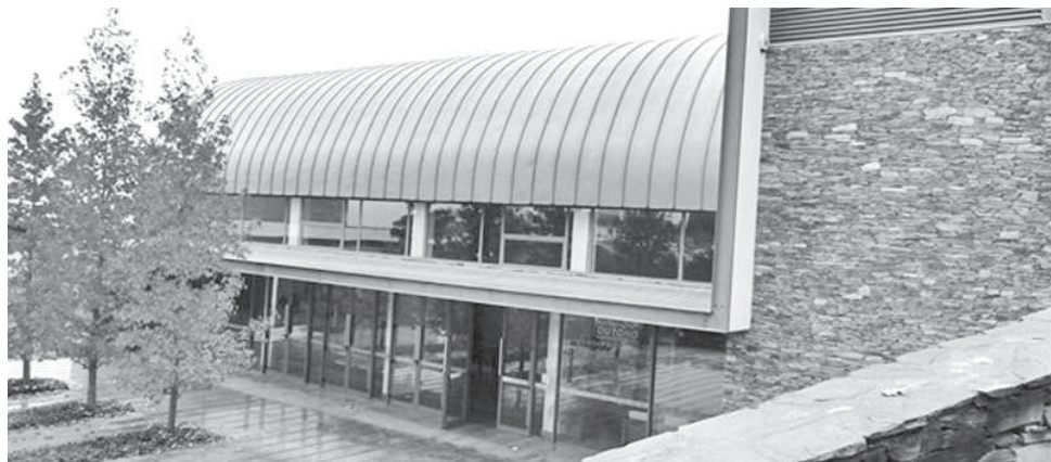
A Festa acontece na Casa de Artes e Cultura do Tejo, com entrada gratuita

Será uma semana com muitos filmes de animação de autores nacionais e internacionais a fechar com a entrega dos Prémios de Animação