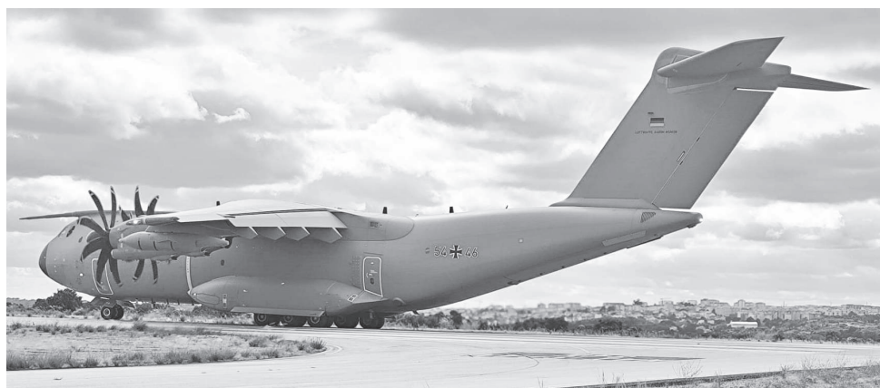
O Aeródromo é ponto de apoio operacional

Para a Câmara de Castelo Branco “a escolha do Aeródromo Municipal de Castelo Branco Comendador Joaquim Morão para integrar o cenário deste curso de elevado rigor técnico é um claro reconhecimento das condições operacionais oferecidas pelo Aeródromo Municipal Albicastrense, nomeadamente, a sua localização estratégica e a qualidade da infraestrutura”.