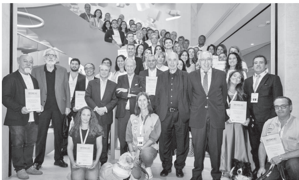
O projeto apresentado pela Liga foi um dos 40 vencedores

dores de instituições sociais do País, o projeto Recanto da Fan-