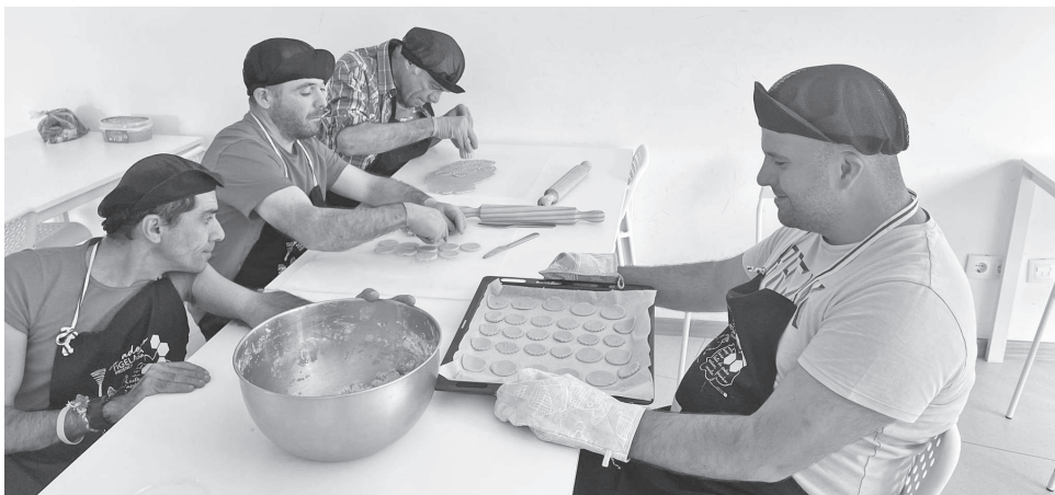
O grupo tem uma ocupação que os faz sentir ter o seu lugar na comunidade

Programa fundamenta-se na produção de plantas aromáticas e atividades para a integração de cada um na comunidade