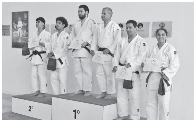
Os atletas do Distrito estiveram em destaque

Esta 10.ª edição foi organizada pela Associação de Judo de Santarém e contou com a participação de atletas provenientes de França, Espanha e Portugal. A competição reuniu quase meia centena de atletas, entre os quais vários medalhados em Campeonatos da Europa e do Mundo.