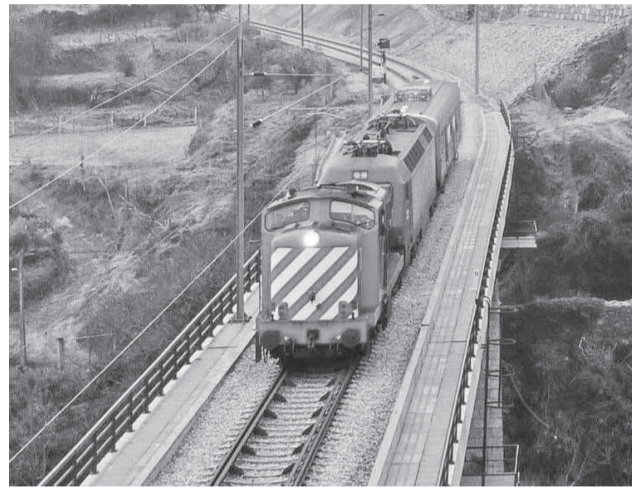
A reparação da Linha da Beira Baixa durará meses

Exigida a rápida reposição da normalidade na Linha para terminar com os problemas de mobilidade com impacto na economia