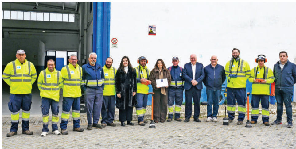
Na entrega do Selo de Qualidade aos Serviços Municipalizados

A distinção reconhece o esforço contínuo da Entidade Gestora na prestação de serviços de excelência, alinhados com os elevados níveis de exigência da sociedade, reforçando o compromisso com a gestão eficiente dos recursos hídricos e a sustentabilidade do