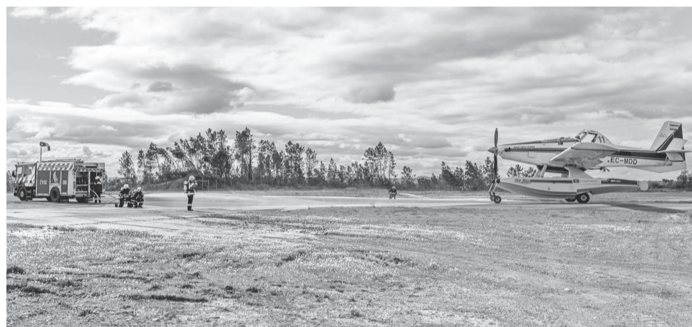
O exercício cumpre o requisito da Aviação Civil Internacional

Testou-se a capacidade de resposta e exequibilidade do Plano de Emergência, para detetar falhas e fazer ajustamentos