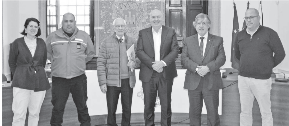
Na assinatura do protocolo de colaboração

O aditamento ao protocolo em vigor define a atualização do subsídio anual, em função do papel do corpo de Bombeiros