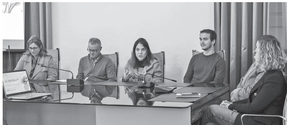
A Equipa Comunitária de Saúde Mental apresentou-se

Pretende-se dar uma resposta de proximidade na área da saúde mental infantil e juvenil, num modelo de intervenção multidisciplinar