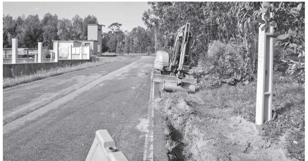
Já se iniciaram as obras de reabilitação da estrada que liga a N240 à Mata

A intervenção consiste na requalificação do pavimento da atual estrada, incluindo a realização de correções e ripagens pontuais, com o objetivo