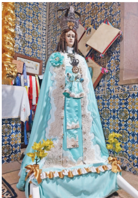
No mesmo fim de semana, duas das mais populares romarias da Beira

18 de abril, às 19 horas, realiza-se a procissão de Santa Ana até ao Santuário e às 21 horas é a vez do terço, na Capela, seguido de procissão.