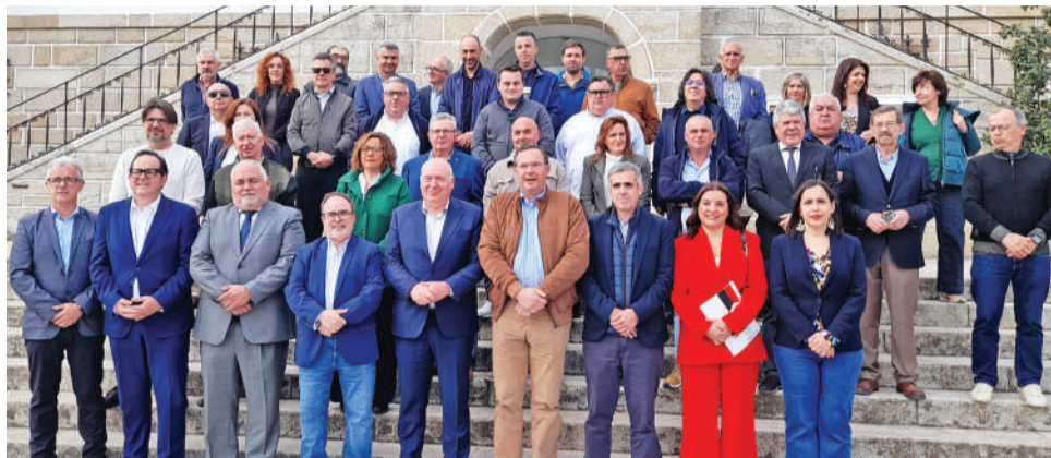
Foto de grupo da Aliança Territorial Europeia reunida em Castelo Branco

Uma segunda medida, concretizada na reunião, foi a “assinatura das petições formais e oficiais, por mais de 30 organizações que estão aqui presentes, para afirmar a solicitude com os grupos parlamentares”, uma vez que são “eles que nos representam e têm que colaborar”. Nesse sentido, serão contactados “tanto os quatro grupos parlamentares da Extre-