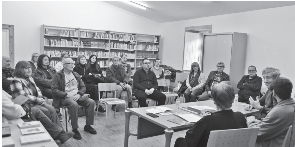
A Alma Azul continua a divulgar os poetas Portugueses

Ana Luísa Amaral nasceu em abril de 1956, e faleceu em 2022, deixando uma obra enquanto professora universitária e tradutora que todos reconhecem de mérito, mas é como poeta que fará parte da história da literatura portugue-