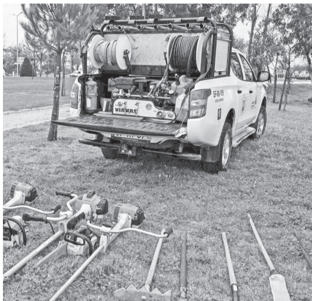
Para repor a normalidade depois da Kristin

O procedimento será desenvolvido por lotes, conforme definido no Plano Municipal de Defesa da Floresta de Castelo Branco de 2026, tendo sido aprovada a decisão de contratar e a respetiva autorização da des-