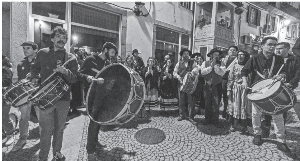
Os bombos vão animar as ruas de Penamacor

Penamacor acolhe, no próximo sábado, 18 de abril, o 2.º Encontro de Bombos da Freguesia de Penamacor, organizado pela Junta de Freguesia de Penamacor, com o apoio da Câmara de Penamacor. O programa começa às 15h30h, com arruadas a partir do Ex-Quartel, continuando às 21h30h, no Largo D. Bárbara Tavares da Silva, com as atuações dos grupos.