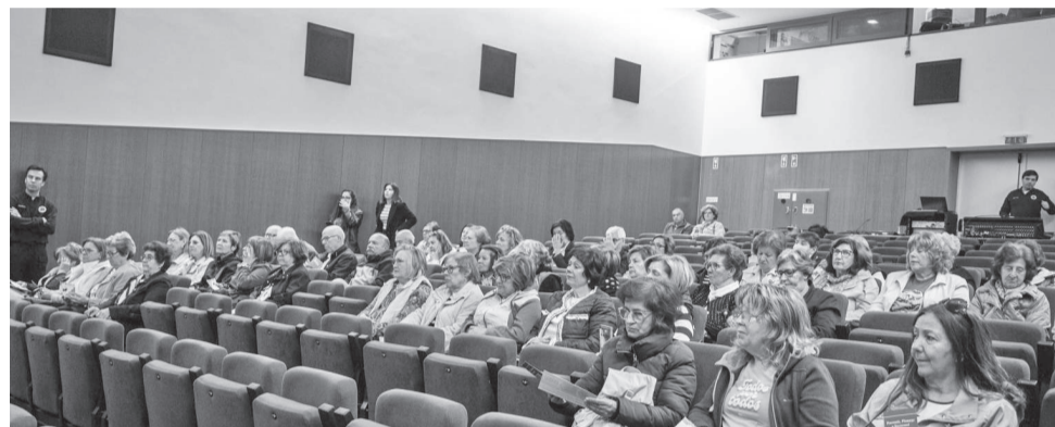
A sessão foi dinamizada pelo Serviço Municipal de Proteção Civil

Promovido pela Câmara de Castelo Branco, no âmbito do Mês da Proteção Civil, este projeto é dirigido aos alunos da USALBI e tem como principal objetivo capacitar a população sénior para atuar em situações de acidente grave ou