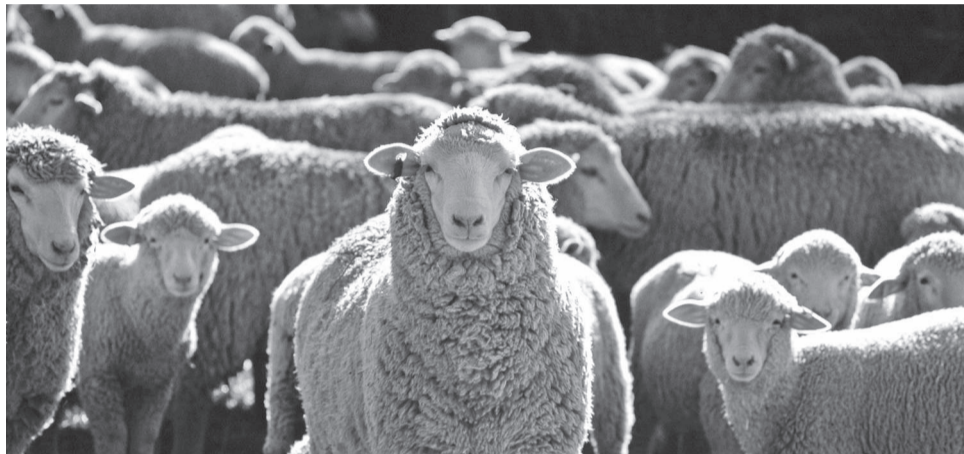
Rebanho de mais de 150 ovelhas Merino da Beira Baixa atravessa a cidade

Memórias da transumância com o rebanho a iniciar o percurso na ESA pelas ruas do centro até ao Parque da Cidade