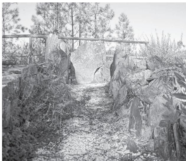
O trabalho arqueológico tem o apoio da Câmara