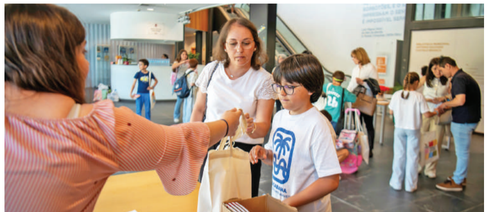
A Biblioteca Municipal é o lugar certo para o Concurso de Leitura

Após a fase escolar, foram apurados os finalistas dos quatro níveis de ensino,