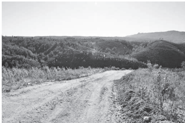
Abrangidos quase 60 mil hectares de área florestal

O objetivo é reduzir o perigo de incêndio através da remoção da carga combustível, numa gestão de paisagem sustentável