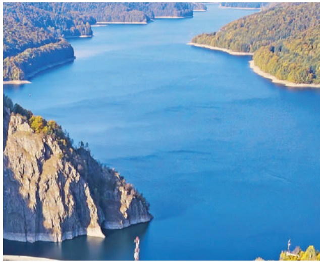
A Barragem Ocreza/Alvito é projeto de décadas

Integra o programa Água que Une para reforço da eficiência hídrica e resiliência a eventos climáticos extremos