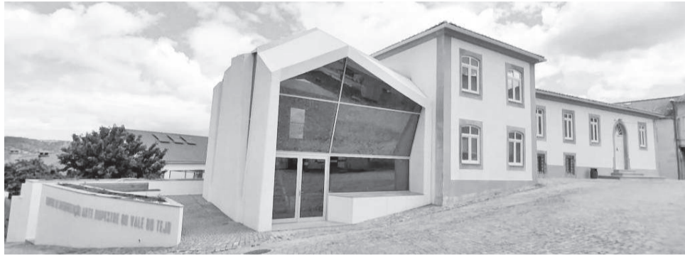
O Centro de Interpretação da Arte Rupestre do Vale do Tejo

Um encontro de ideias e saberes onde se aprende a moldar peças de vidro à chama, em sessões de três horas