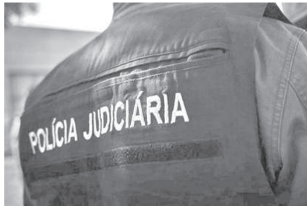
O homem é suspeito de três crimes de violação

A investigação iniciou-se no passado dia 15 de maio, após queixa efetuada pela própria vítima, no Posto Territorial da Guarda Nacional Republicana (GNR), em Zebreira, Concelho de Idanha-a-Nova, tendo a última agressão ocorrido poucas horas antes.