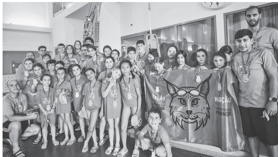
Os nadadores de Penamacor, anfitriões do Encontro de Escolas de Natação

O Encontro de Escolas de Natação de Penamacor, que decorreu dia 9 de maio, na Piscina Coberta Municipal, reuniu cerca de 100 nadadores. A sétima edição do Encontro, organizado pela Câmara de Penamacor, reuniu, além da escola anfitriã, que participou com 35 elementos, as escolas de Almeida, do Centro Social Padres Redentoristas de Castelo Branco, de Oleiros, do