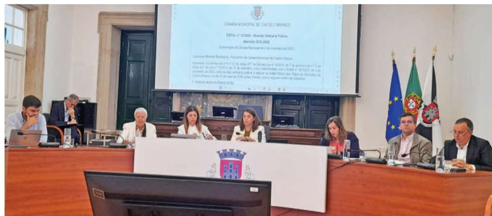
Na sessão pública da Câmara de 15 de maio