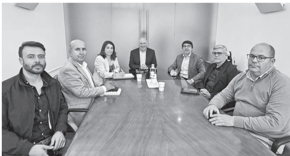
Reunião a pensar na estratégia de saúde para o Concelho

No encontro foi referido que “embora Castelo Branco apresente indicadores satisfa-