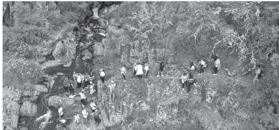
O Passeio Pedestre passa pelo Monte e Cascatas de S. Martinho

A XIV edição do Passeio Pedestre, é organizada pela Associação Juvenil Ribeiro das Perdizes e termina com almoço