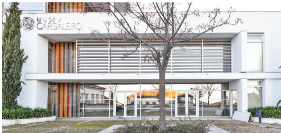
O Museu Cargaleiro está incluído no programa, com uma visita guiada

O programa tem início durante a manhã, entre as oito e as 13 horas, no Mercado