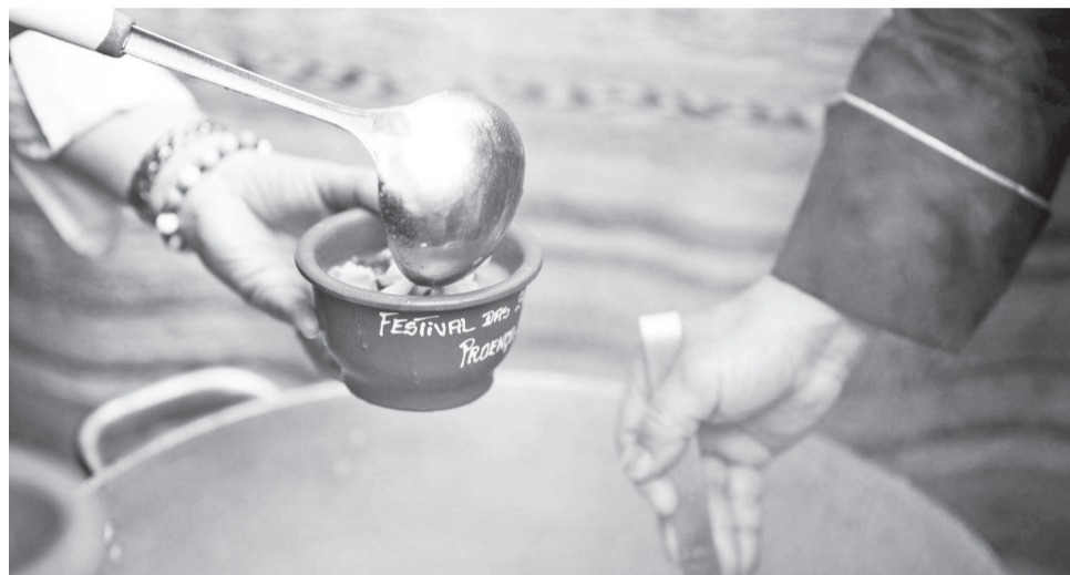
Um festival de sopas tradicionais para comer e chorar por mais

No que respeita ao Festival das Sopas são cerca de 100 sopas a concurso, no próximo domingo, 24 de maio, dando a conhecer sopas confeccionadas com saberes antigos e ingre-