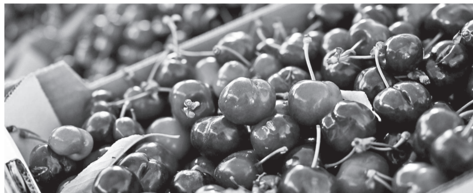
A cereja dos Montes da Senhora tem festival agrídoce com o limão

Com o apoio da Câmara de Proença-a-Nova, o Festival reúne gastronomia, tradição, música e atividades que valorizam dois produtos ícones