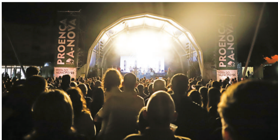
A música é sempre a grande atração das festas

O Parque Urbano Comendador João Martins, em Proença-a-Nova, é palco, entre a próxima sexta-feira e domingo, 12 a 14 de junho, da Festa do Município de Proença-a-Nova, que este ano integra as comemorações