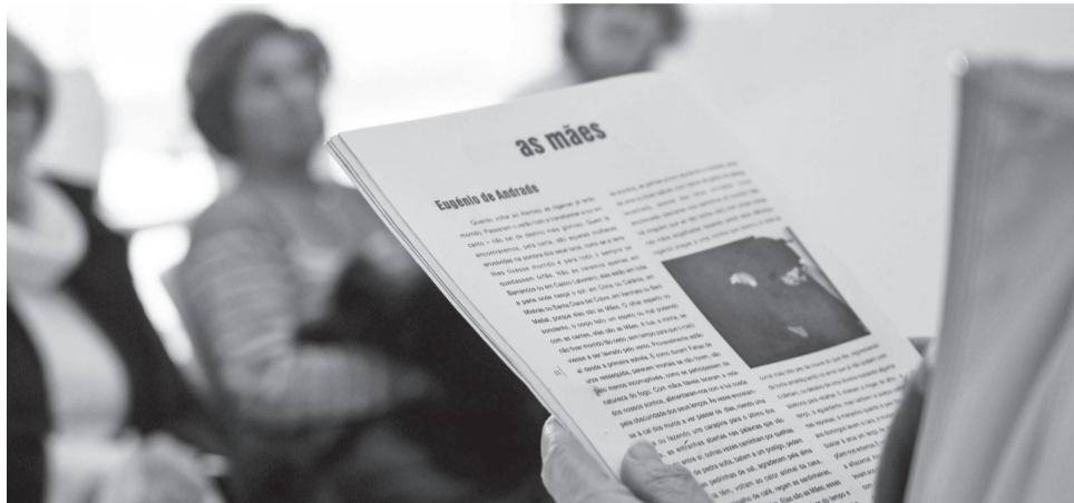
No semestre, foram muitas as leituras comunitárias de prosa e poesia

Encerra com a leitura de obras de Miguel Torga, Carlos Oliveira, Al Berto, Eugénio de Andrade e Fernando Pessoa