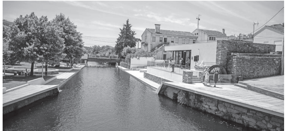
A obra promovida pela Câmara foi financiada pelo Turismo de Portugal

ção contou com a animação da Associação Recreativa e Cultural Grupo de Bombos de Almaceda e terminou com um almoço-convívio.