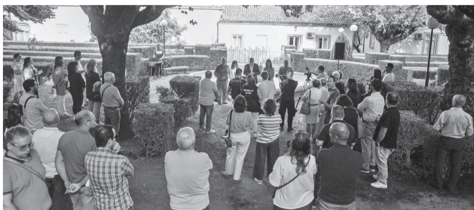
A sombra e a frescura das sombras das amoreiras marcam o jardim

Após os trabalhos de recuperação e manutenção, passa a integrar a rede de espaços verdes de acesso público