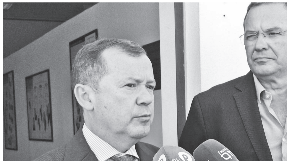
O secretário de Estado da Proteção Civil esteve presente na apresentação

Numa época que se prevê difícil, o Dispositivo Especial de Combate a Incêndios Rurais tem assegurados os meios necessários