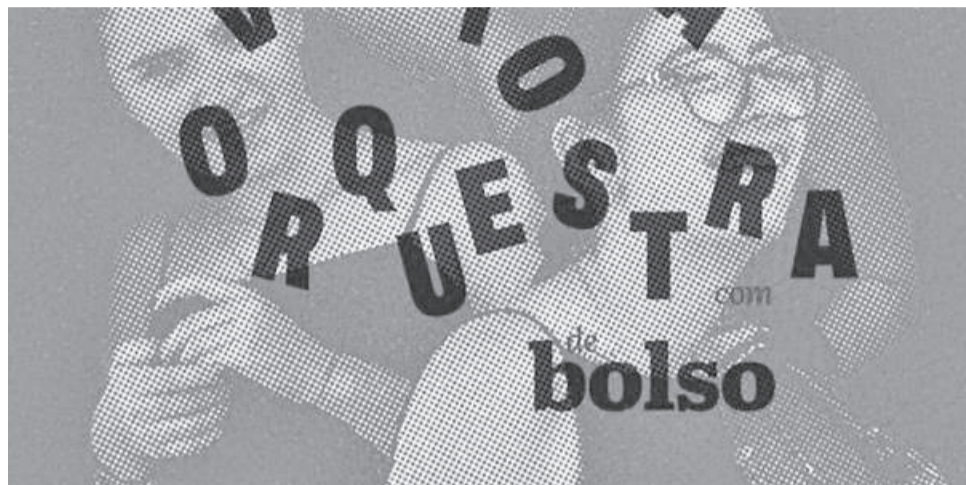
É o resultado da parceria da Orquestra sem Fronteiras com a Câmara

O programa começa no próximo sábado, 13 de junho, às 17 horas, na Sede da ADE-