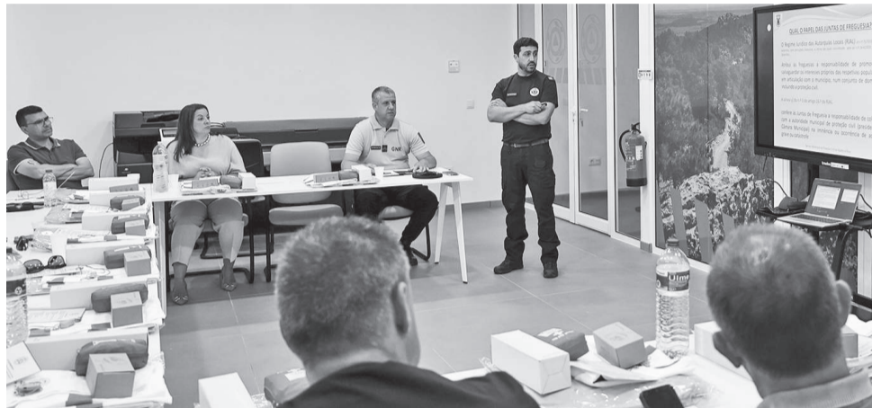
Na reunião debateu-se a realidade operacional do Concelho

A ordem de trabalhos começou com a explicação do funcionamento e a importância das Unidades Locais