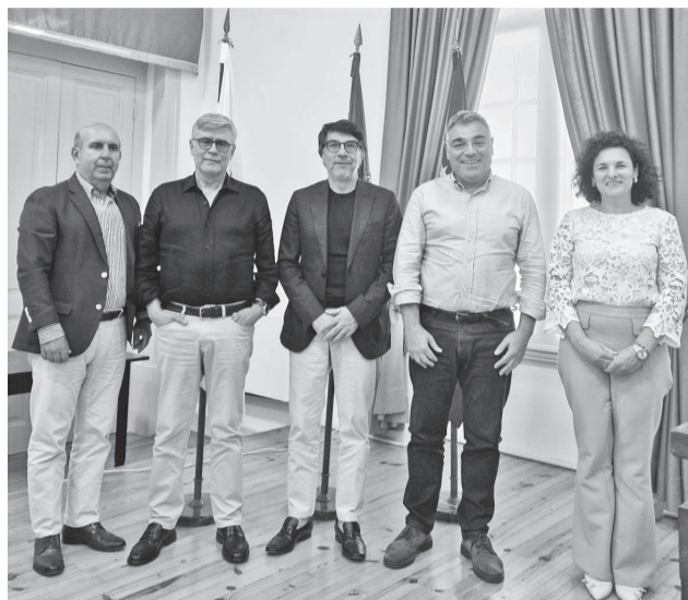
Na reunião da autarquia com a ULSCB

Estiveram em análise os Cuidados de Saúde Primários e estratégias de atração e fixação de profissionais de saúde