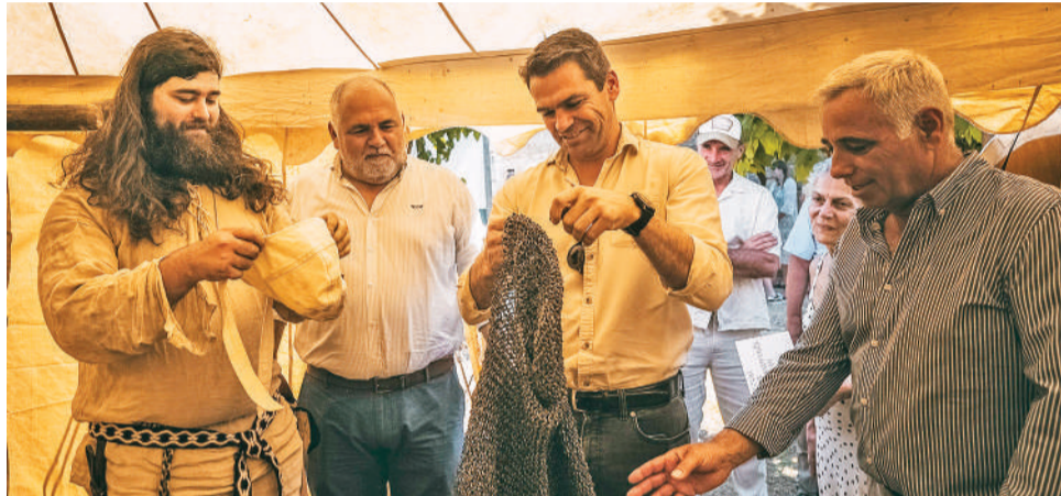
O Grupo Váatão recriou o momento histórico

O momento alto do certame decorreu logo no primeiro dia, 30 de maio, com a recriação simbólica da leitura do foral concedido por D. Manuel I em 1 de junho de 1510, evocando a importância deste documento na época Manuelina e promovendo, simultaneamente, a preservação e valorização do património histórico e iden-